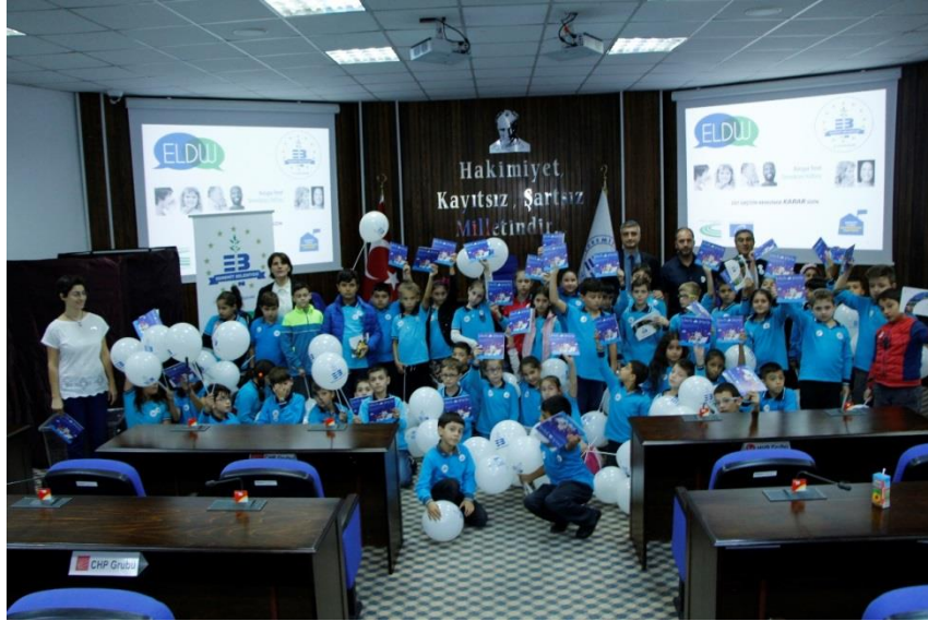
Des enfants faisant l'expérience de la démocratie à Edremit (Turquie)